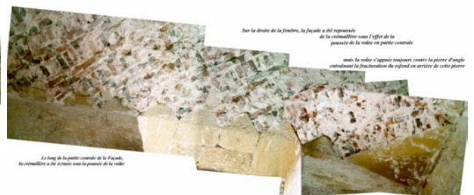
Sur la droite de la fenêtre, la façade a été réparée de la corniche sous l'effet de la poussée de la voûte en partie centrale