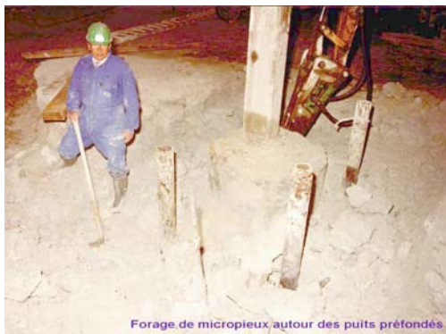
Forage de micropieux autour des puits profonds.